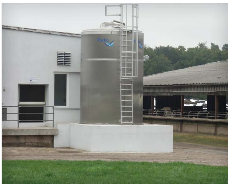
Zvýšit a zastabilizovat kvalitu mléka se povedlo v loňském roce investicí do mléčného tanku na 25 000 l

Ing. Jaroslav Matyk Limagrain