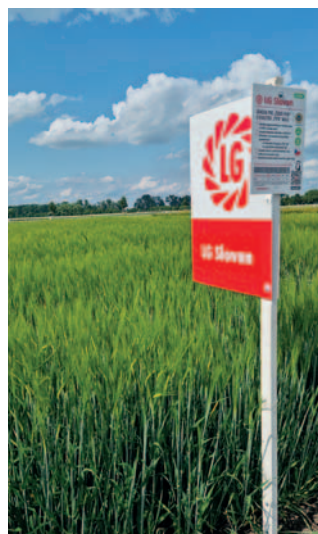
Pěstitelé oceňují vysoký výnos, plasticitu a velmi dobré pěstitelské vlastnosti odrůdy LG Slovan

Odrůda má relativně velké zrno s HTZ okolo 47 g. Díky tomu dosahuje vysokého podílu předního zrna (91 % v SDO ÚKZÚZ) a i vysokého výnosu předního zrna. Zároveň si zachovává optimální obsah NL v zrnu okolo 11 %.