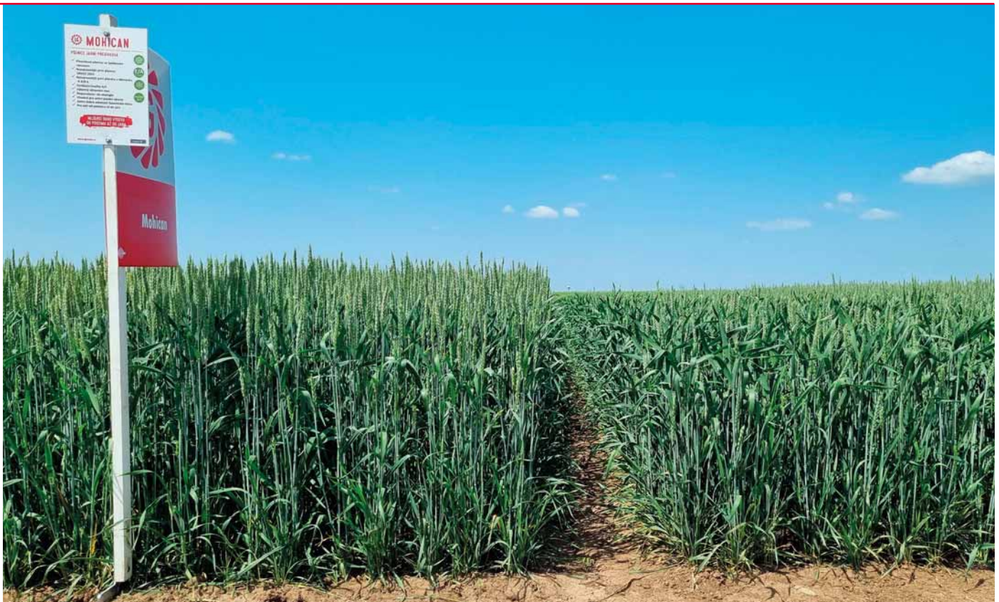
Podzimní zásev Mohicanu (vlevo) má na jaře výrazný náskok ve vegetaci; rozdíl v ranosti oproti včasnému jarnímu zásevu (na fotce vpravo) bývá i 10–14 dní; foto polní den Hrubčice 12. 6. 2025