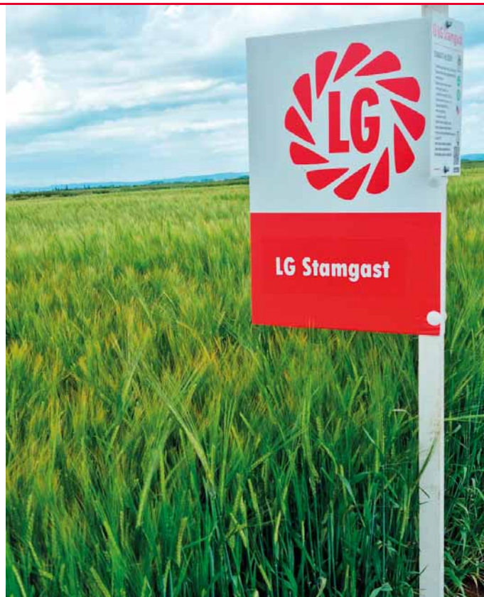
Nová odrůda LG Stamgast byla vyšlechtěna na šlechtitelské stanici Limagrain v Hrubčicích u Prostějova a je doporučena pro výrobu piva s CHZO „České pivo“.