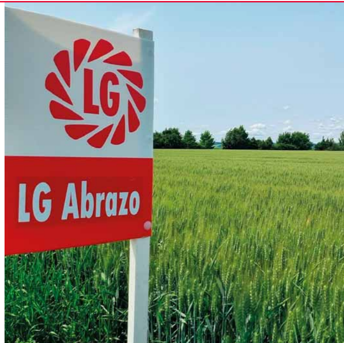
Vyrovnaný, zapojený, nepolehlý porost bez rostlin odchylného typu,“ stálo v protokolech z obou povinných přehlídek ÚKZÚZ