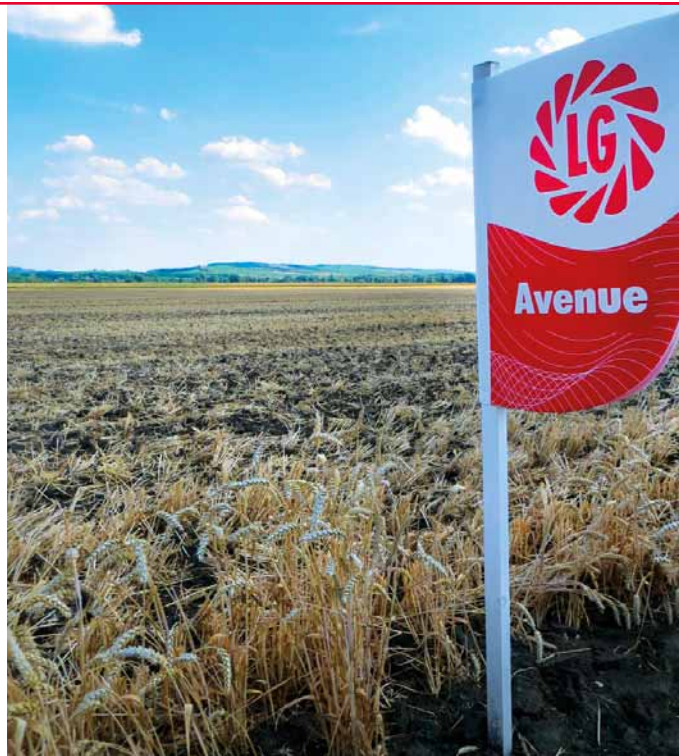
První sklizená pšenice