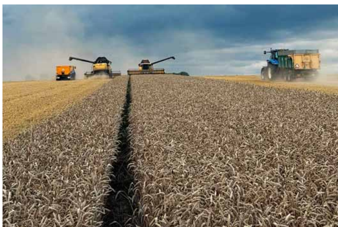
Sklizeň ve Velešovicích 11. 7. 2025: vysoký výnos, nízké ztráty a ve vzduchu bouřka → ani odvoz nestíhá!